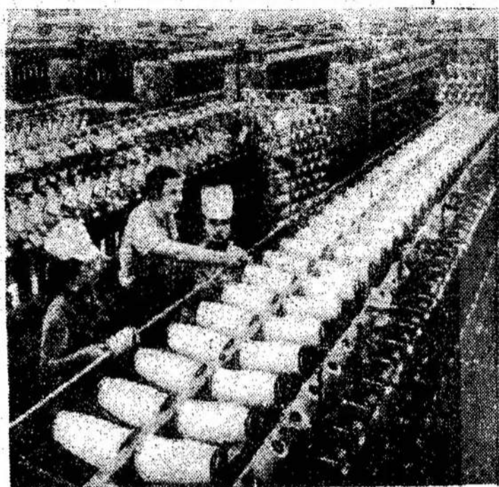
Kauno dirbtinio pluošto gamyklos ceche.

Miami. — Prekinis laivas Bimini Gal nuskendo prie Andros salos prie Bahamos su 840 dėžių degtinės.