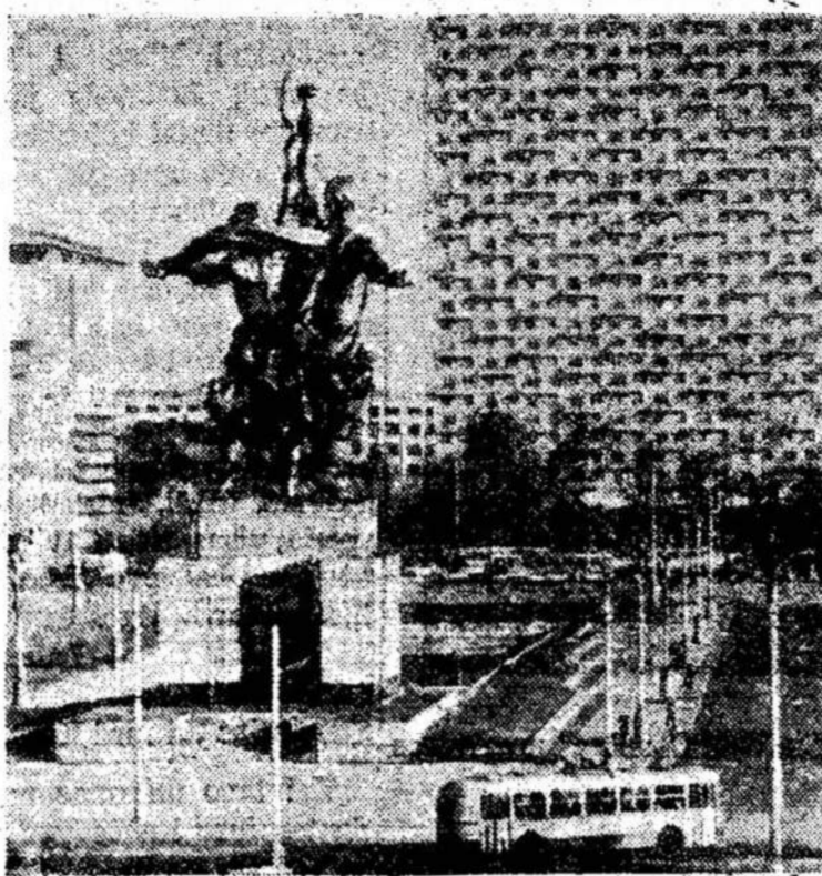
Nuotraukoje: Maskvos daugiaaukščiai

Toronto. — Ryerson Technikos Institutas atleisias apie 20 dėstytojų, kadangi šiamejį įstojo 700 studentų mažiau, negu buvo tikėtasi.