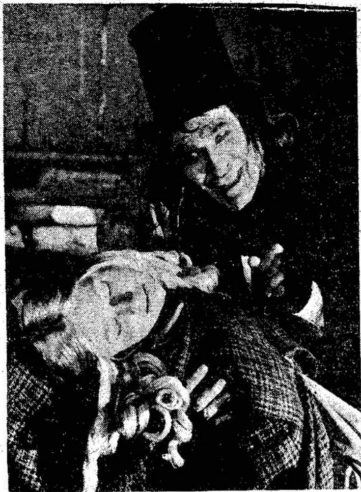
Johnny Wayne ir Frank Shuster, žymieji Kanados komikai

Iš tokio požiūrio paeinančio auklėjimo, plus neteisingos visuomeninės santvarkos, daugelis lieka pastumti į kriminalistinį kelią.