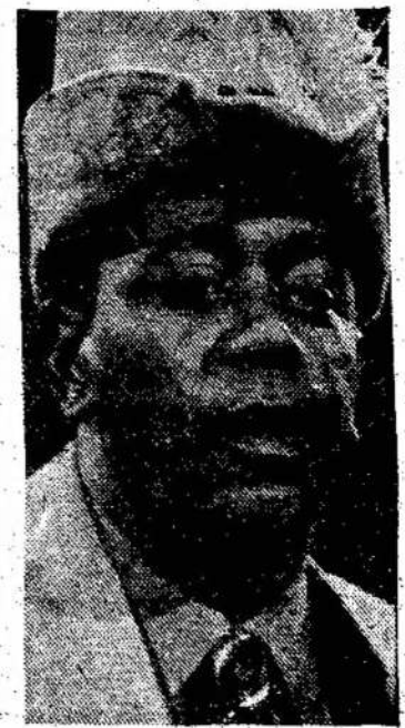
Flip Wilson, "Flip Wilson" programos ant televizijos žvaigždė.

Komisija nepaaiškina, kaip galima būtų apsaugoti nepilnamečius, jeigu bus leidžiama suaugusiems.