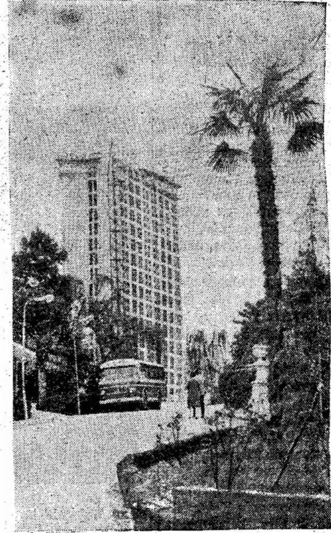
Uzbekijos TSR. Žavingame Sočio kampelyje pastatyta dar viena sanatorija "Uzbekiston".