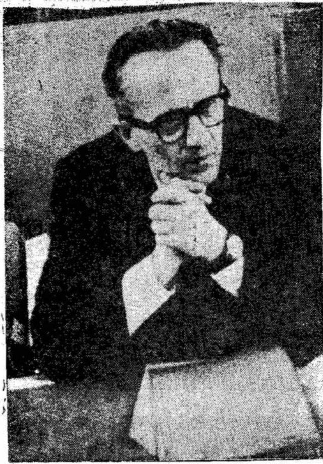
Pasaulinio garso mokslininkas, Vilniaus universiteto rektorius profesorius Jonas Kubilius.

Daug daugiau žmonių važinėtų gatvėkariais ir autobusais, jeigu patarnavimas būtų geresnis. Daugelyje vietų autobusai vaikšto labai retai, ypač dienos metu. Žiemą stovėti 20 ar 30 minučių ant lauko yra labai nemalonu. Gerinant patarnavimą, aišku, daugės ir keleivių.