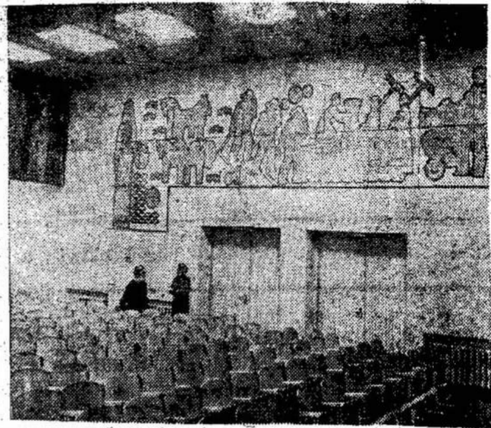
Naujus kultūros namus pasistatė Jurbarko rajono "Gegužės Pirmosios" kolūkio žemdirbiai. Nuotraukoje: kultūros namų salė.