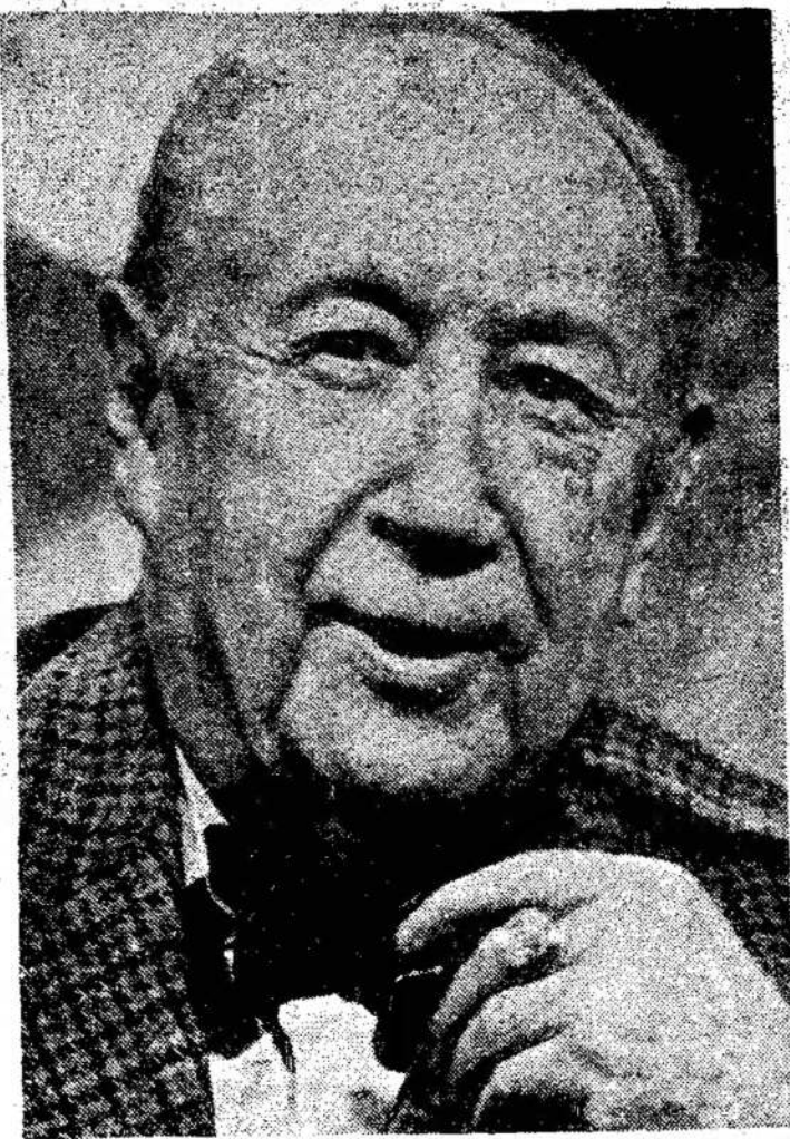
Gordon Sinclair, radio ir televizijos darbuotojas. Ant televizijos jis dažnai matomas "Front Page Challenge" programoje.

Roma. — Protesto demonstracijoj praėjusią savaitę Romoje dalyvavo 200,000 žmonių. Demonstrantai reikalavo didesnių algų ir socialinių reformų.