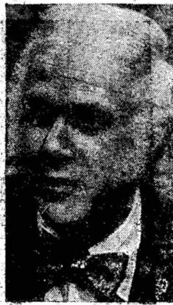
Pierre Berton, žymus Kanados autorius ir televizijos darbuotojas. Jis yra parašęs keletą knygų.

Greitu laiku Australijos ir Naujosios Zelandijos vyriausybių vadovai žada susitikti