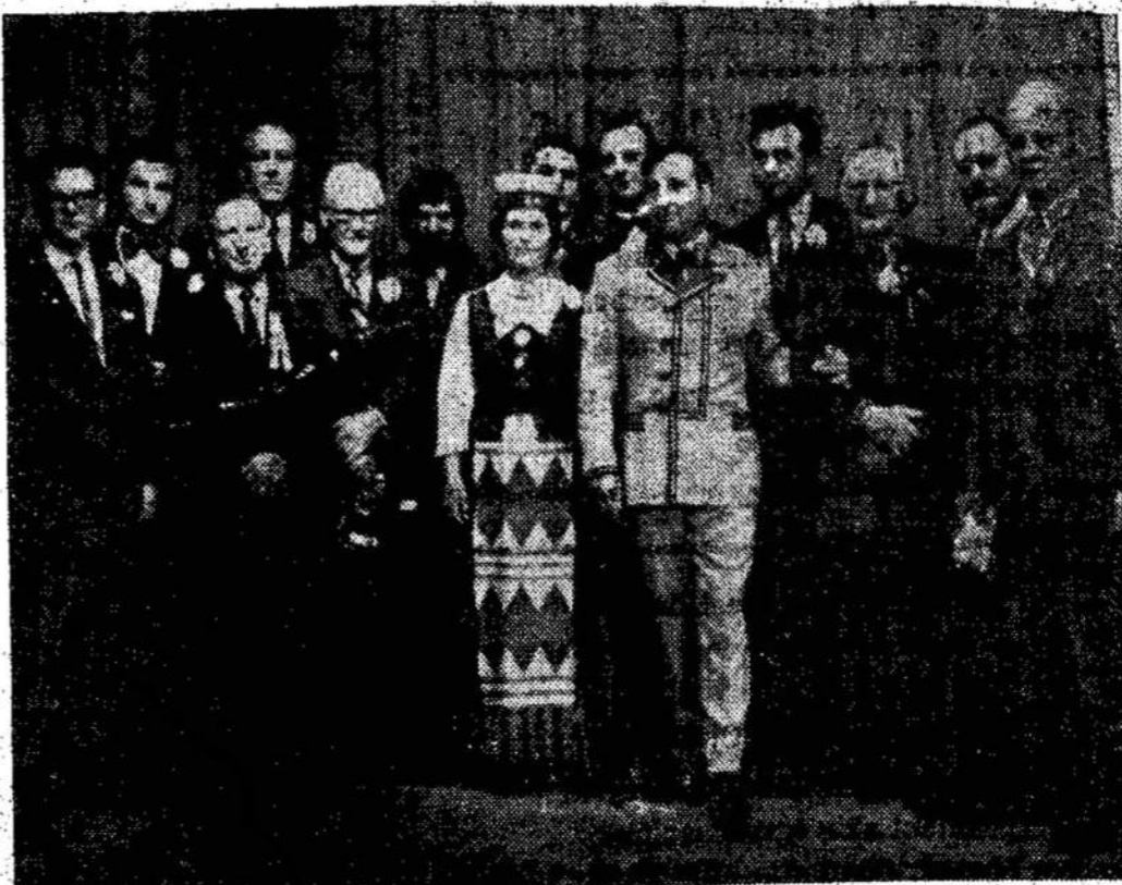
Daug neužmirštamų įspūdžių iš susitikimų su pažangiais tautiečiais parsive-

Travel Centre Kennedy Travel Bureau Ltd. 123 March St. 296 Queen St. West Suite 106 Toronto 2B, Ontario Sault Ste Marie, Ont. EM. 2-3226 Tel.: (705) 254-7191