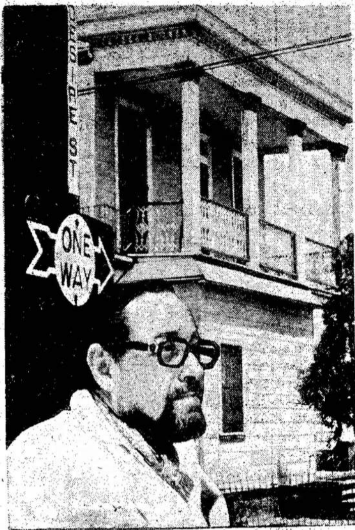
Tennessee Williams, laikomas vienu iš žymiausių dramaturgų Amerikos kontinente.