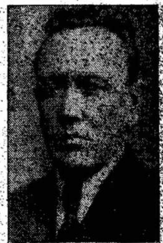
Jurgis Baltrušaitis (1873 - 1944)

Korespondentas prašes Vienių redakcija neskelbti jo navardės, nes jis bijes Naujienų "patriotų" moralinio ir fizinio teroro. Tie "patriotai" naudojms tautiečiams "yra įsėdže namus raudonais dažais, vidurnakti skambine telefon ir garsinę dar kitaip keršyti.