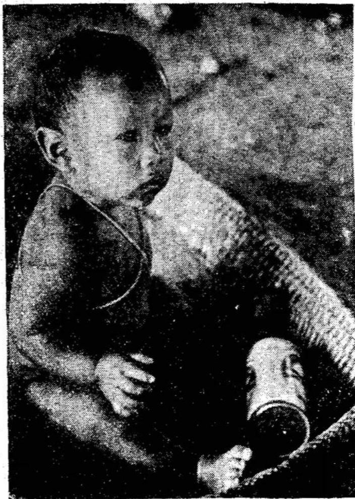
Nufilmuotas 27 šalyse "The Ascent of Man" serijinis pastatymas ant televizijos aiškina apie mokslo istoriją kaip žmogaus istoriją. Matomas iš CBC televizijos stočių, nuo 10 val. vak. Nuotraukoj: Brazilijos indijonukas.

Tiesa, ateivių kultūrinių grupių pasirodymai angliškai kalbančių dar nesudomino. Į parengimus jie mažai atsilanko. Labai mažai atsispindi ateivių veikla ant televi-