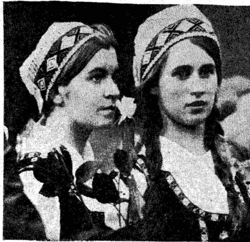
Nuotraukėje: lietuaitės pavasario šventėje.

Nežiūrint to, atrodo, kad kanadiečiai turėtų pakeliauti po savo šalį. Ne tik pinigai pasilikę Kanadoje, bet ir daug ko įdomaus pamatyti, geriau pažintų Kanadą.