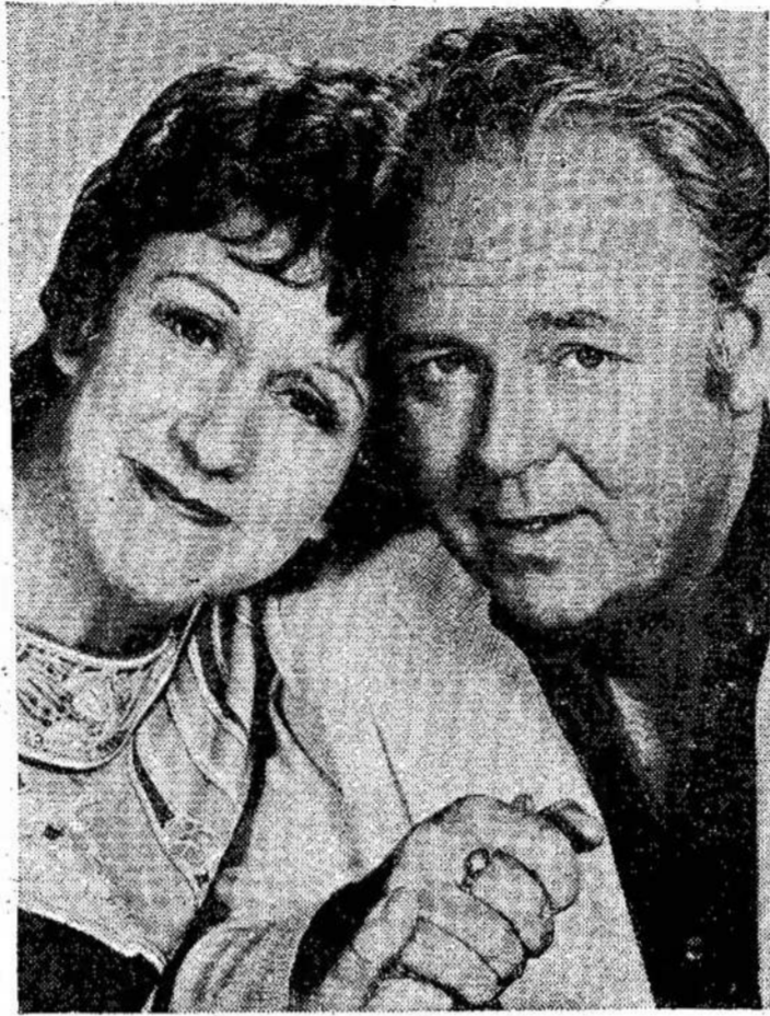
Archie Bunker (aktorius Carrol O'Connor) ir jo žmona Edith (aktorka Jean Stapleton). Kurie žiūrėję televizijos "All in The Family", gerai juos pažįstat.