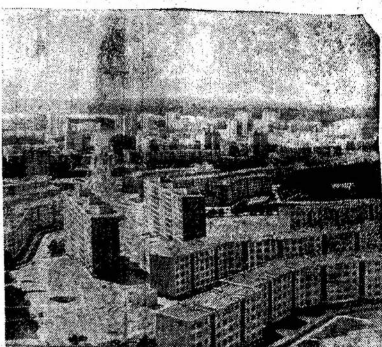
VILNIUI — 650

Rugsėjo 9 dieną įvyks išvažiavimas pas V. Vekterie-