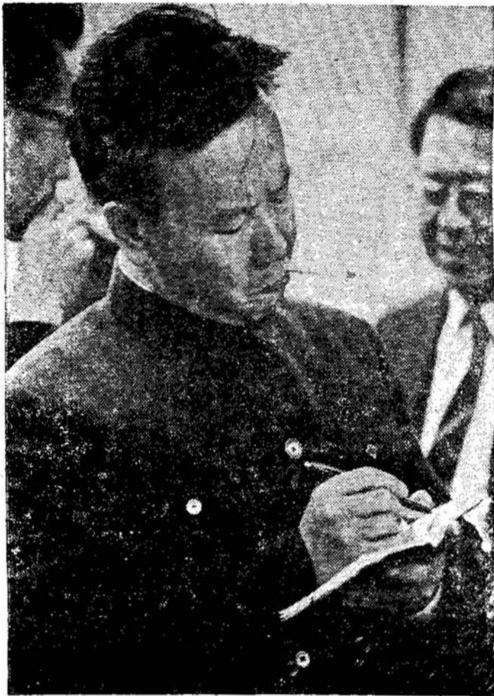
Kinijos Liaudies Respublikos grupė iš 21 laikraštiniųko lankėsi Kanadoje ir JAV. Nuotraukoje matote vieną iš jų CBC kabinete užsirašant savo įspūdžius.

Nauji demokratai, naudodami protingą taktiką, gali paveikti parlamentą taip, kad jis priimtų gerus įstatymus, mažiausia geresnius, negu galima tikėtis iš konservatų. Pasikarščiavimas gali brangiai atsieiti naujiems demokratams. O yra tokių naujų demokratų, kurie norėtų nuversti liberalus nieko nelaukiant. Jie, matyti, nepagalvoja apie to rezultatus.