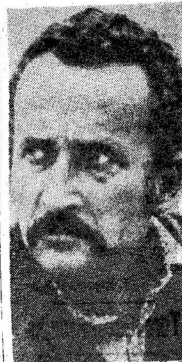
Nuotraukoje: režisierius Vytautas Žalakevičius.