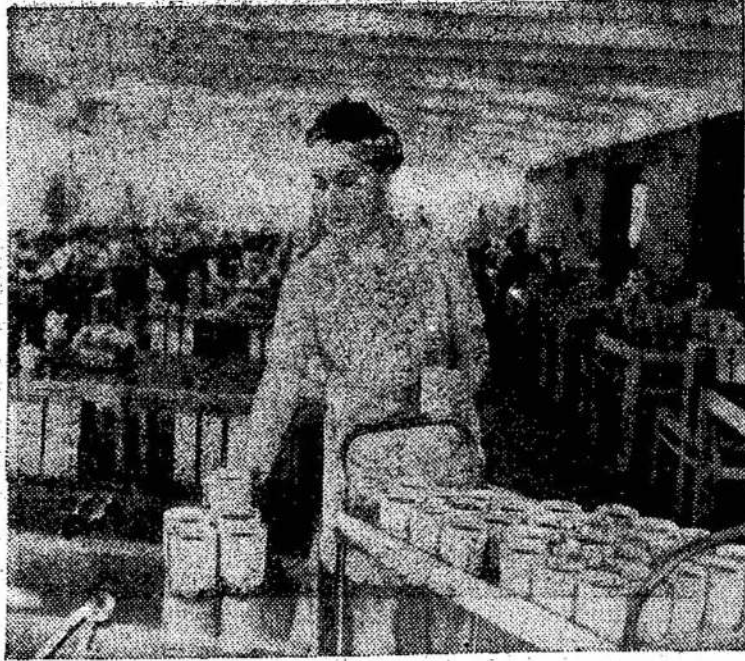
Naujosios Druskininkų "Nemūno" sanatorijos valgykloje vienu metu gali papietauti 1,300 poilsiautojų.

Barrie, Ont. — Žaibas uždegęs Community Centra, padarė nuostolių už $75,000.