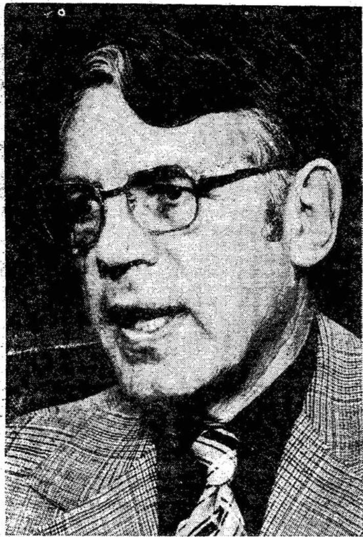
Howie Meeker, kurs trečiadieniais vakarais duos pamokas dėl būsimų hoki žaidėjų. Perduos CBC TV nuo pusės po septynių.