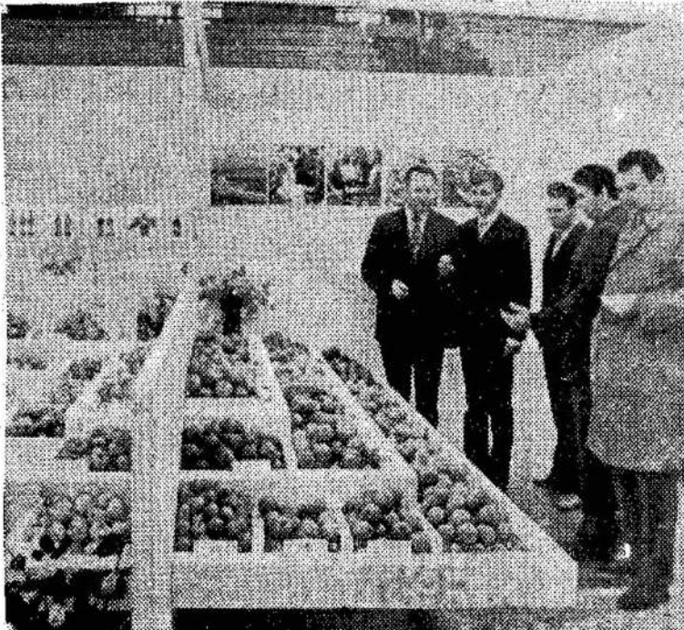
Kauno sporto halėje buvo surengta respublikinė ru- dens gėrybių paroda. Joje dalyvavo 13 sodininkystės, 10 daržininkystės ir 40 bitininkystės ūkių. Nuotraukoje: prie parodos stendų.