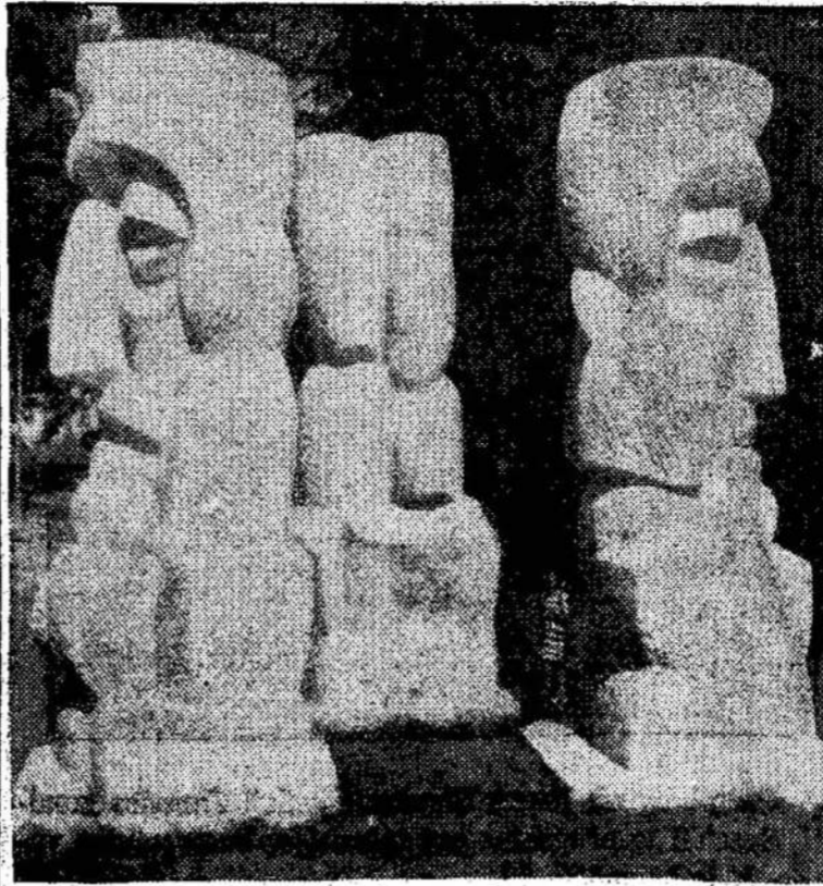
Netoli katedros neseniai atidengta skulptūra "Lietuviškoji baladė". Pagal lietuvių liaudies skulptūros tradicijas sukurdamas šis tautosakinį kūrinį, dailininkas Vladas Vildžiūnas sakosi norėjęs užakcentuoti, kad Vilnius — legendų apgaubtas miestas.