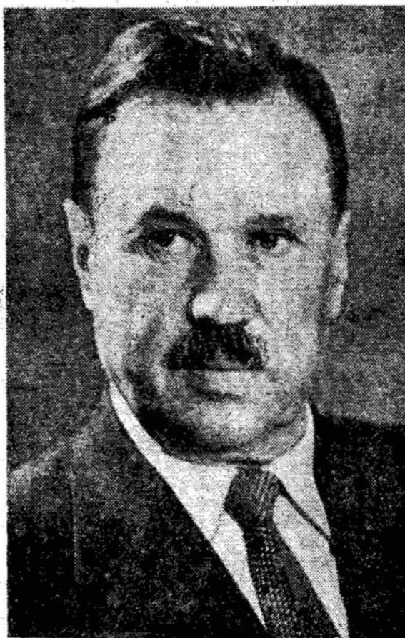
Antanas Sniečkus, LKP CK pirmasis sekretorius, staiga miręs sausio 22 d. 1974 m.

Kredituojama naujų demokratų partija už liberalų nuolaidas. Kiek čia tiesos yra, sunku pasakyti. Bet liberalai galėjo daryti nuolaidas konservatams ir tokiu būdu išsilaikyti. Kai kuriose provincijose liberalai ir konserva-