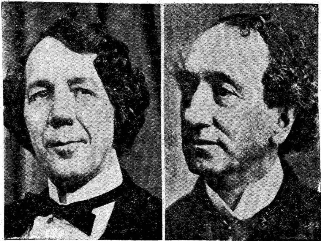
Versatilus Kanados aktorius William Hutt (kairėje); vaizduoja Sir John A. Macdonaldą CBC pastatyme „The National Dream“, pagal P. Bertono veikalą apie CPR geležinkelio tiesimą per Kanadą. Pastatymas prasi- dės kovo 3 dieną, 9 valandą vakaro. Sekite spaudą, TV programas, kurios įvairiais būdais garsinamos.

Leningrade vienas dezaineris suplanavęs panašų cepeliną, galintį skristi iki 10,000 mylių be sustojimo, nešdamas 200 keleivių ar 20 tonų krovinio.