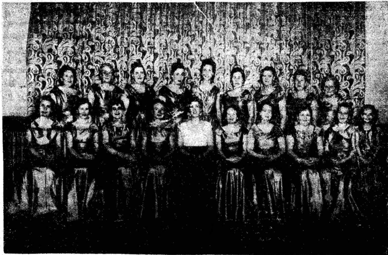
Toronto Lietuvių Moterų choras, daug gražaus kultūrinio darbo atlikęs savo gyvavimo metu.