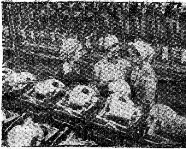
Klaipėdos "Triniųčių" medvilnės verpimo fabriko sukimo lenkimo ceche.