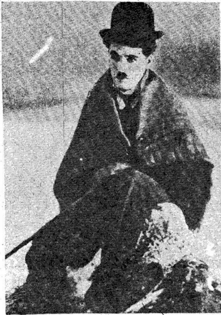
Charlie Chaplin, kurio filmai dabar rodomi ant CBC televizijos sekmadieniais nuo 8:30 v. v.