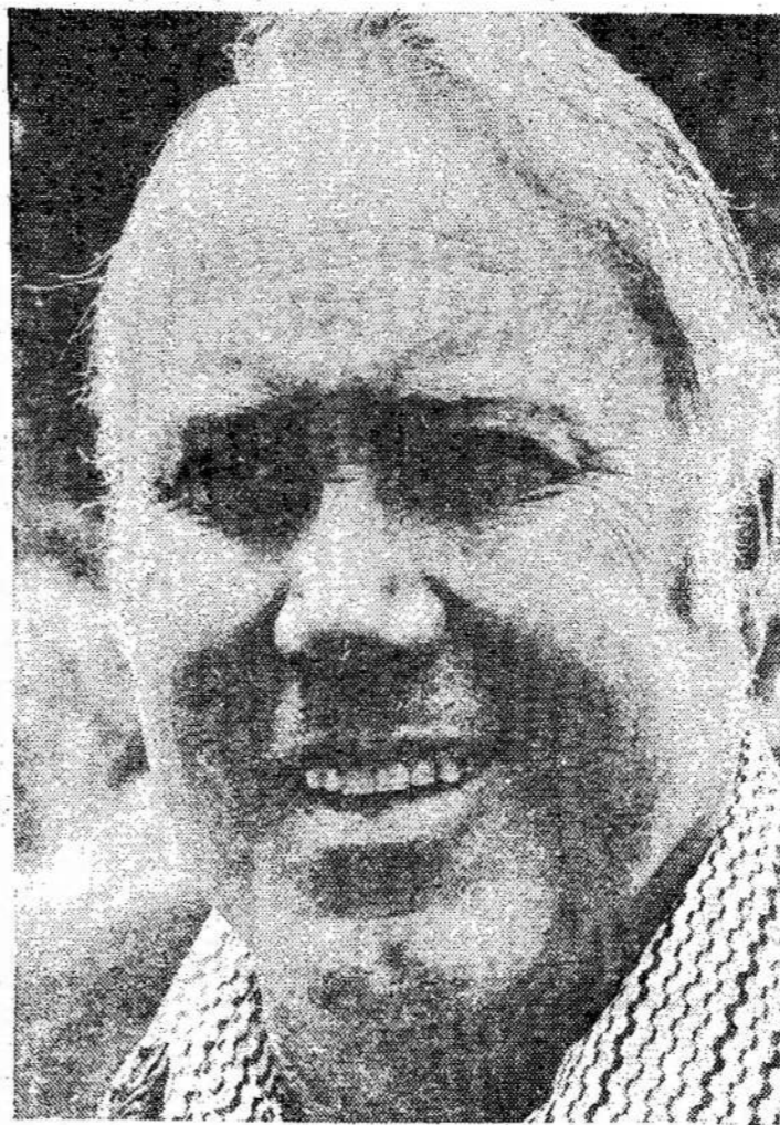
Duke Snider, vienas iš Brooklyn Dodger's originalų "Boys of Summer", dabar žaidžia dvi roles su Montreale Expos. Žaidimus perduoda CBC TV.

Paryžius. — Francija šią bandymų Francija nebedavasarą darys nuklinius bandymus Pacifike. Bet po šių bandymų Francija nebedarys daugiau bandymų atmosferoj.