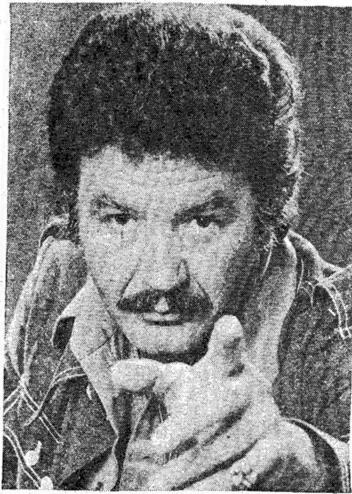
Aktorius Bruno Gerussi, kurs vaidina pagrindinę rolę televizijos pastatyme "Beachcombers". Naują sezoną pradės rugsėjo 15.

Prekyba, apylamai, naudinga visoms valstybėms. Jos