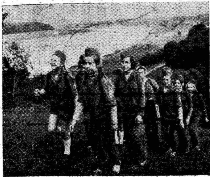
Kačerginėje, prie miškingo Nemuno vingio, šią vasarą išsėjosi daugiau kaip 6 tūkstančiai vaikų.

Miestai užlaikomi labai švariai, nėra šiukšlių ant gatvių. Žmonės mandagūs, draugiški ir skoningai apsi-