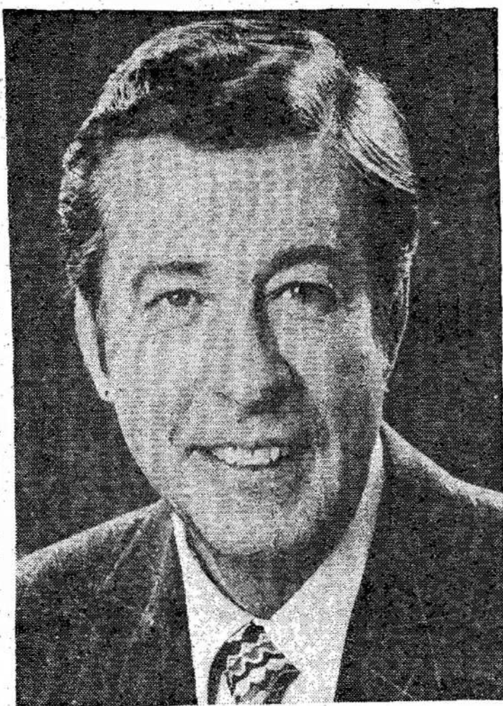
Fred Davis, kurs pirmininkauja televizijos pastatyme "Front Page Challenge". Aštuonioliktą sezoną pradės rugsėjo 17.

Bet jo neliečia. Jis geras. Pagal jo planą buvo sugriauta Čilėje Allendės valdžia, Kipre iššauktos kovos, žmonių