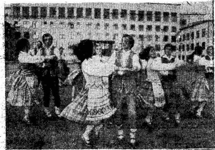
Nuotraukoje: šoka Lietuvos žemės ūkio akademijos ansamblio šokėjai.