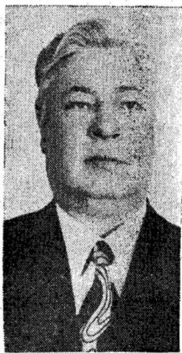
Lietuvos KP. Centro Komiteto pirmasis sekretorius Petras Griškevičius.

Buvo spaudoje pranešta, kad buvo surasta tokių, kurie be jokio mokslo užsiima gydymu adatomis. Kai po dešimties ar daugiau atsilankymų ligonis nesijaučia geriau, jam pasako, kad jo pagydyti negalima tokiu būdu. Žmogaus viltis ir pinigai nu-eina vėjais.