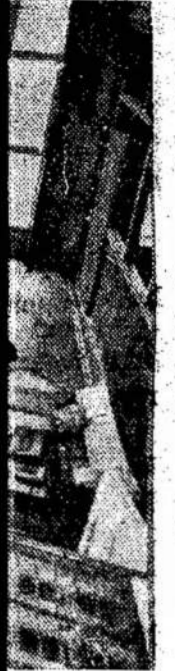
Telefono stoties centras. Šalia nuotr.)