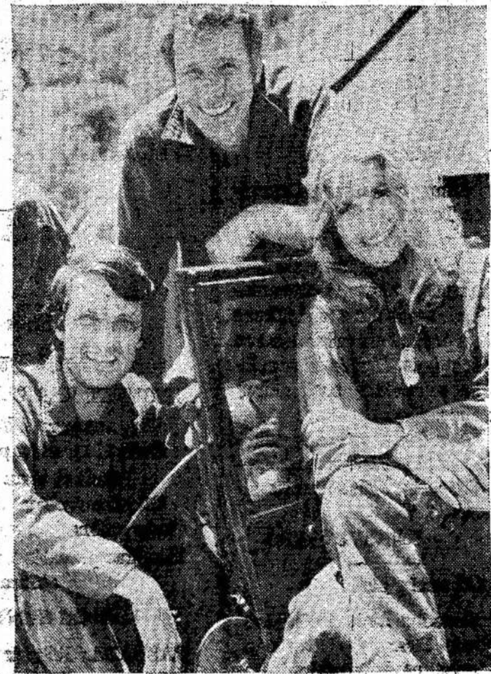
Alan Alda, Wayne Rogers ir Loretta Swift iš televizijos pastatymo MASH. Matomas penktadienį vakarais.

Keli kalbėtojai prisiminė tu didvyriškų kovų metus — prie Leningrado, Maskvos, Stalingrado. Kanadiečiai išsilalpino prie Djepo. Tarybų Sąjungos žmonės parodė nepaprastą ištvėrmę ir pasiaukojimą gindami savo kraštą nuo fašizmo. Kanados veteranai parodė skaidres iš savo dalinių, kovojusių įvairiuose sąjungininkų fron-