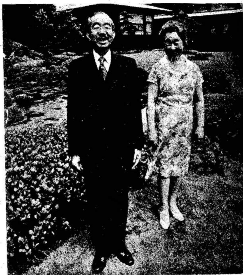
Japonijos imperatorius Hirohito pastaruoju metu lankėsi JAV. Nuotraukoje jis matomas su žmona. Nežiūrint to, kad Japonija kariavo su JAV, prezidentas Fordas juos priėmė labai svetingai.