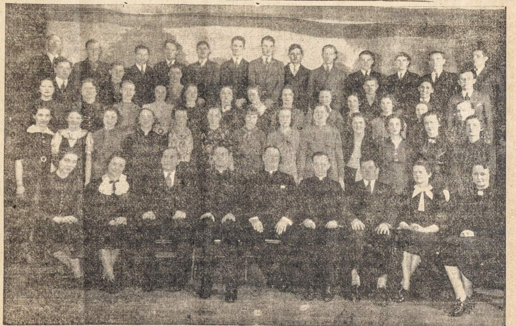
šv. Jurgio Parapijos Choras kuris dalyvaus "Lietuvių Žinių" pirmutiniame paren gime

VASARIO 6, 1938 - šv. Jurgio Auditorijoje 3 Dovanos prie išangos - Bilietai tik 25c