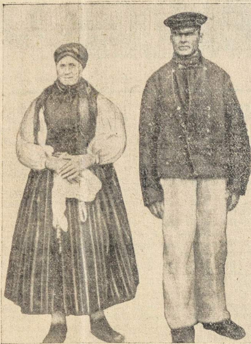
Prieš 15 metų atvaduojo lietuvių tautiniais drabužiais. Klaipėdos vaizdai. Klaipėdos krašto lietuvininkai senovės

Reiktų susiprasti ir pamesti bauriaus muštynes ir keiksmus, o ypač jaunimui to bauriaus įpročio atsikratyti.