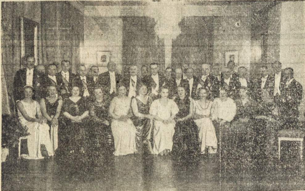
Lietuvos užsienių reikalų Ministeris p. St. Lozoraitis su svečių valstybių atstovais ir jų ponėmis.

Pradėjus sumanytą darbą, radau entuziastingą pritarimą bei paramą plačiosios Amerikos lietuvių visuomenės. I trumpą laiką aplankęs tik dalį Amerikos lietuvių kolonijų surinkau