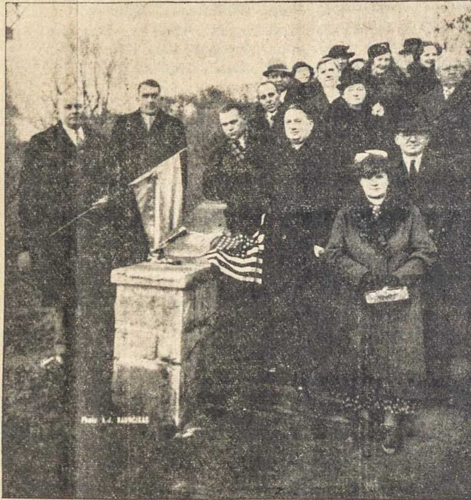
Šis vaizdas ir įvykusių iš- L.R.K.S.A. auksinio jublie- kilmų Lietuvių Kulturi- jaus. Tarp Amerikos ir Lie- niam Daržely Cleveland, O- tuvos vėliavų matosi bron- hio, kur 1936 m. likosi pas- nė plak su šių iškilmių užra- dintas medis paminėjimui šu.

KOTOVICAI, bal. 28. — Le- nkijoje gyvena apie vienas milijonas vokiečių. Iki šio- liai jie visi buvo pasiskir- tę į septynias politines parti- jas. Dabar vokiečiai jungia- si į vieną organizaciją su šu- kių: "Vieni žmonės, viena bendromė, viena vadovybė." Matyt, juos paveikia na- cių propoganda.