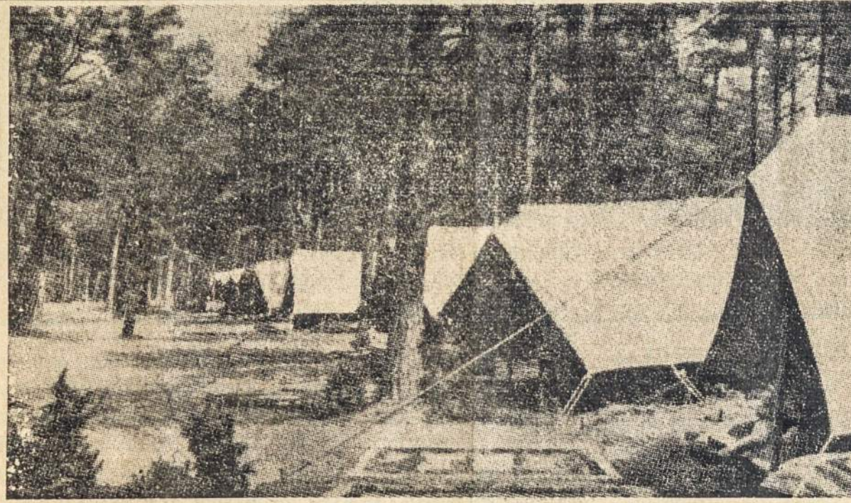
Lietuvos jaunuomenė vasaromis mėgsta stovyklauti. Šiame atvaizde matome vienos tokios stovyklos vaizdą gražioje Lietuvos pajurio miške.

ŽASLIAI. — Žaslių valsčiaus savivadybė yra numačiusi šią vasarą pastatyti savų dviejų aukštų murinį namą. Namo projektas jau paruoštas. Darbai netrukus prasidės.