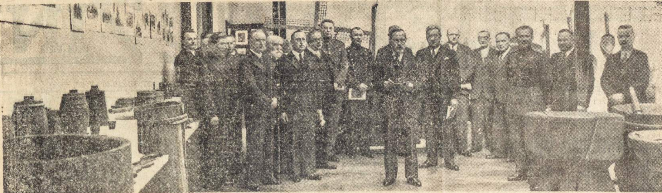
Lietuvos Valstybės Prezidentas Antanas Smetona aplanko Lietuvos etnografinės parodos atidarymą. Etnografinė paroda buvo atidaryta Vytauto Didžiojo Kultūros Muziejuje.