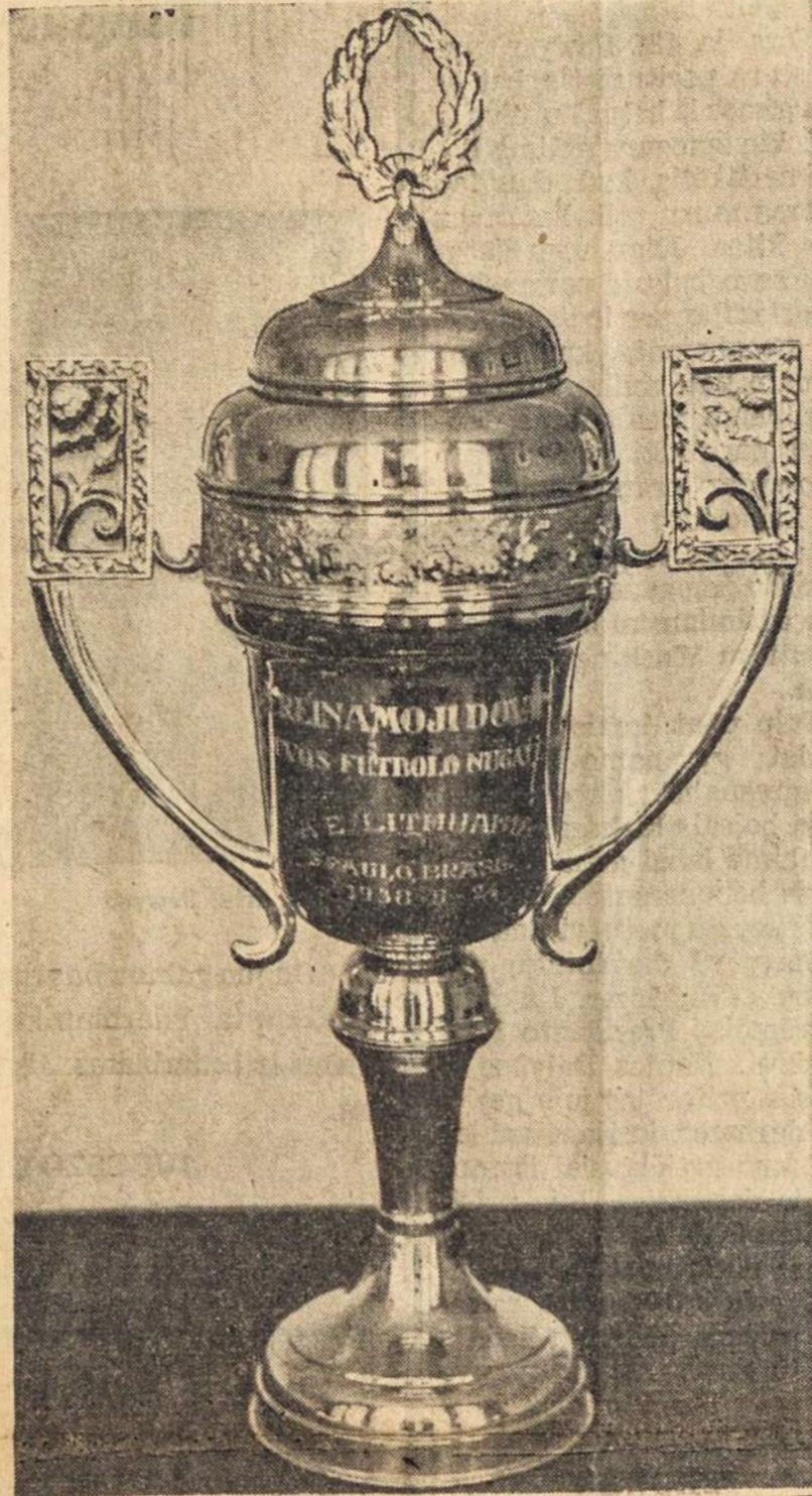
Pictured above is a rugby trophy, donated to the Physical Culture Institute of Lithuania, by "Lithuania", an athletic society of Brazil Lithuanians. The trophy is to be presented to the championship rugby team of Lithuania, and is to remain in permanent possession of the first team to win the championship three times.