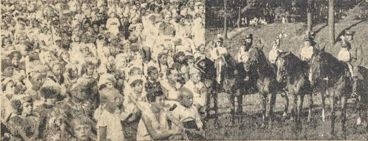
Vaidžiai iš vaikų šventės A. Panemunėje, įvykusios rugpiučio 21 d. 1 — vaikai

KAUNAS, rugs. 4. — Dalyvaujant ministrui pirmininkui V. Mironui, Joniškėje įvyko Tautos Šventė, kuri sutraukė tukstantis artimesnės ir tolimesnės apylinkės gyventojų.