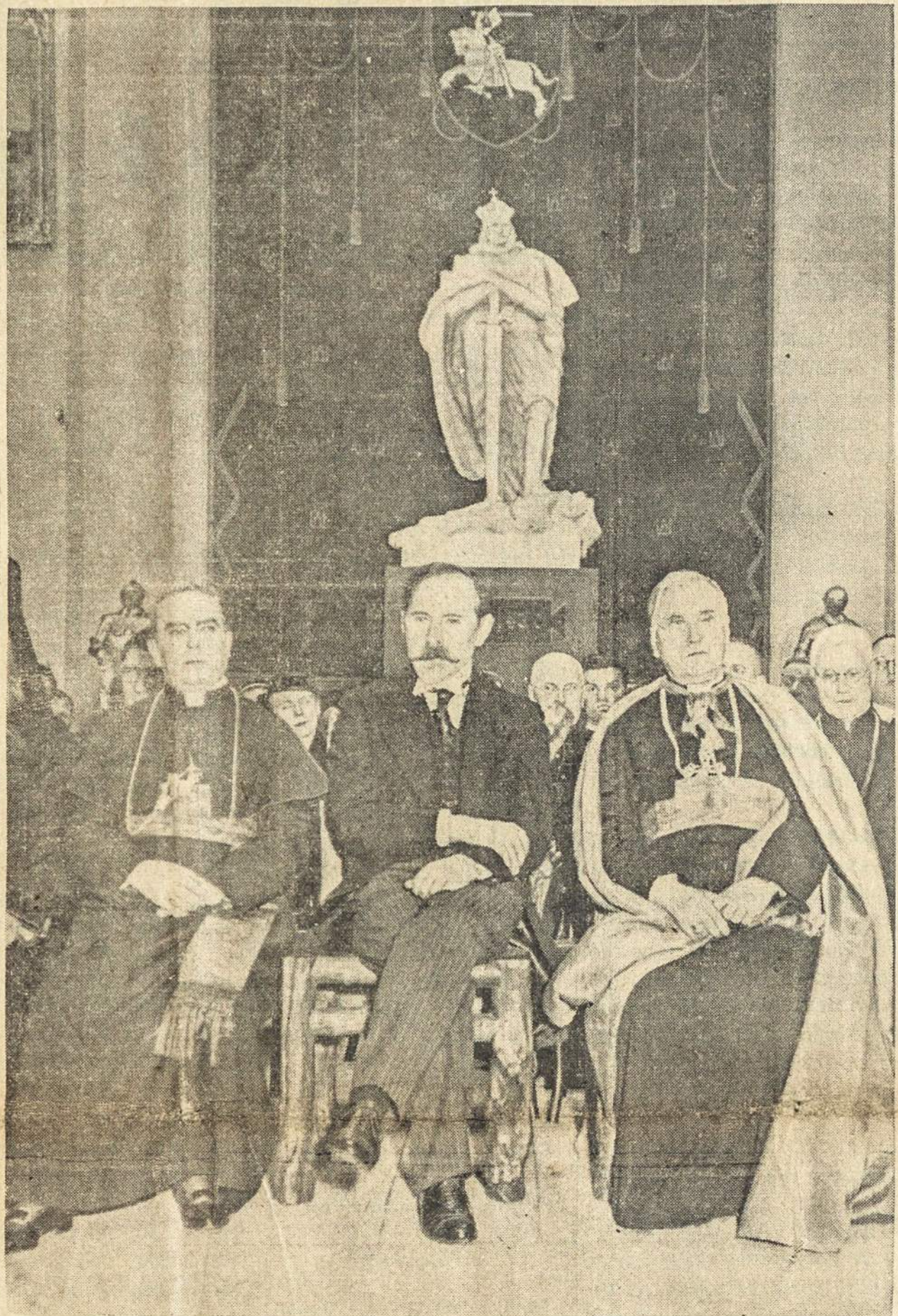
Lietuvos Valstybės Prezidentas Antanas Smetona tarp aukštųjų Bažnyčios dignitarių. Prezidento dešinėje sėdi Vatikano atstovas Lietuva ir Latvijai monsinjoras Juozapas Skvireckas.

KAUNAS, rugs. 20. — Šiominis dienis vyriausybė pateikė Seimui svarstyti Lituanistikos Instituto ir nukentėjusiems nuo nelaimingų atsitikimų žemės ukio darbininkams aprūpinti įstatymo projektus.