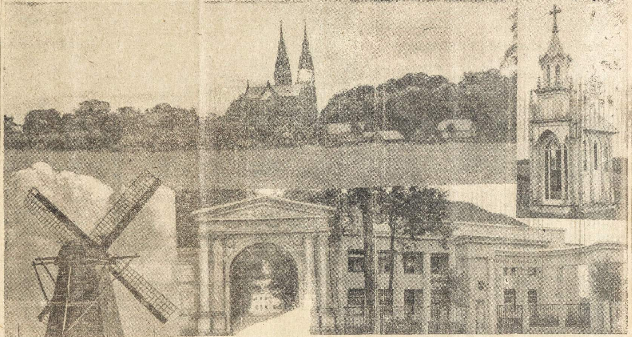
Šių dienų Žemaitija. Virstelio vaizdas, (aukštai kalyje bendras Svėkšnos mielpė) prie Pašilės kelio kplytėlė, budingas vėjo ma-lunas, (apačioje viduryje) Svėkšnos parko vaizdas ir ko rumai Tragėje.

Turkų vadai pripažįsta, kad Turkijoje nėra tinkamo vyro, kurs galėtų mirusiojo vieta užimti ir vykdyti jo pradėtus visus Turkijos gerovei darbus.