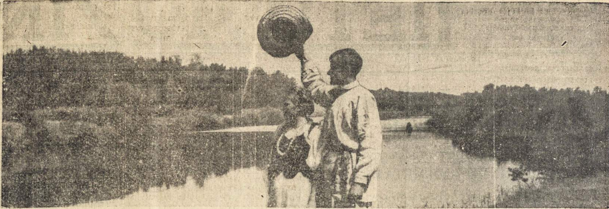
VENTOS UPE TARP MAZEIKIŲ IR VIEKŠNIŲ