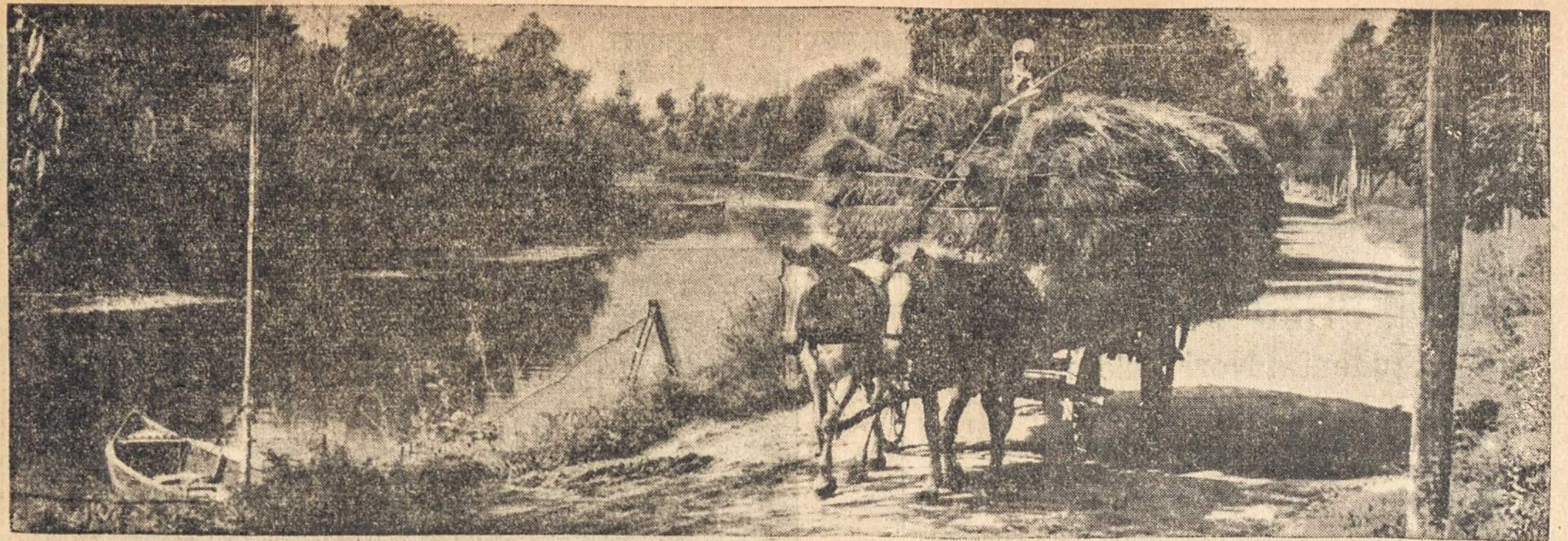
VAIZDAI IŠ KLAIPĖDOS KRAŠTO