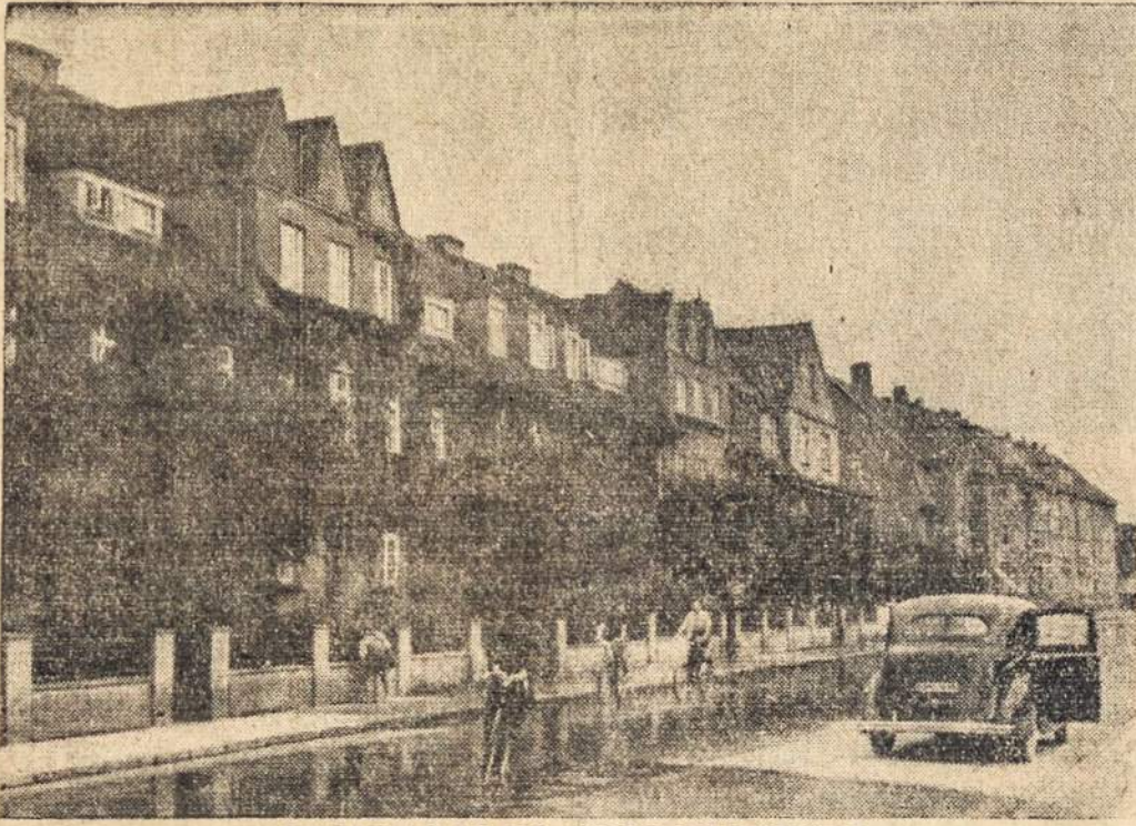
VAIZDAS IŠ KLAIPĖDOS Miesto

WASHINGTON, gr. 1. — Karo departamentas kariuomenės vadovybei pranešė, kad visoj šaly 10,000 fabriku parinkta ir, prireikus, bus paskirtas klaipėdiškis.