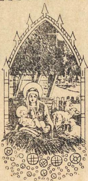
Garbė Dievui Aukštybėje, o ramybė žmonėms ant žemės

ATIDAROMA ANTROJI LIETUVIAMS LIGONINĖ Seserys kazimierietės šiandien atidaro Chicagoje antrą lietuviams ligoninę — The Willard Hospital, 645 So. Central ave. Ligoninės vardas bus pakeistas į Loreto Hospital.