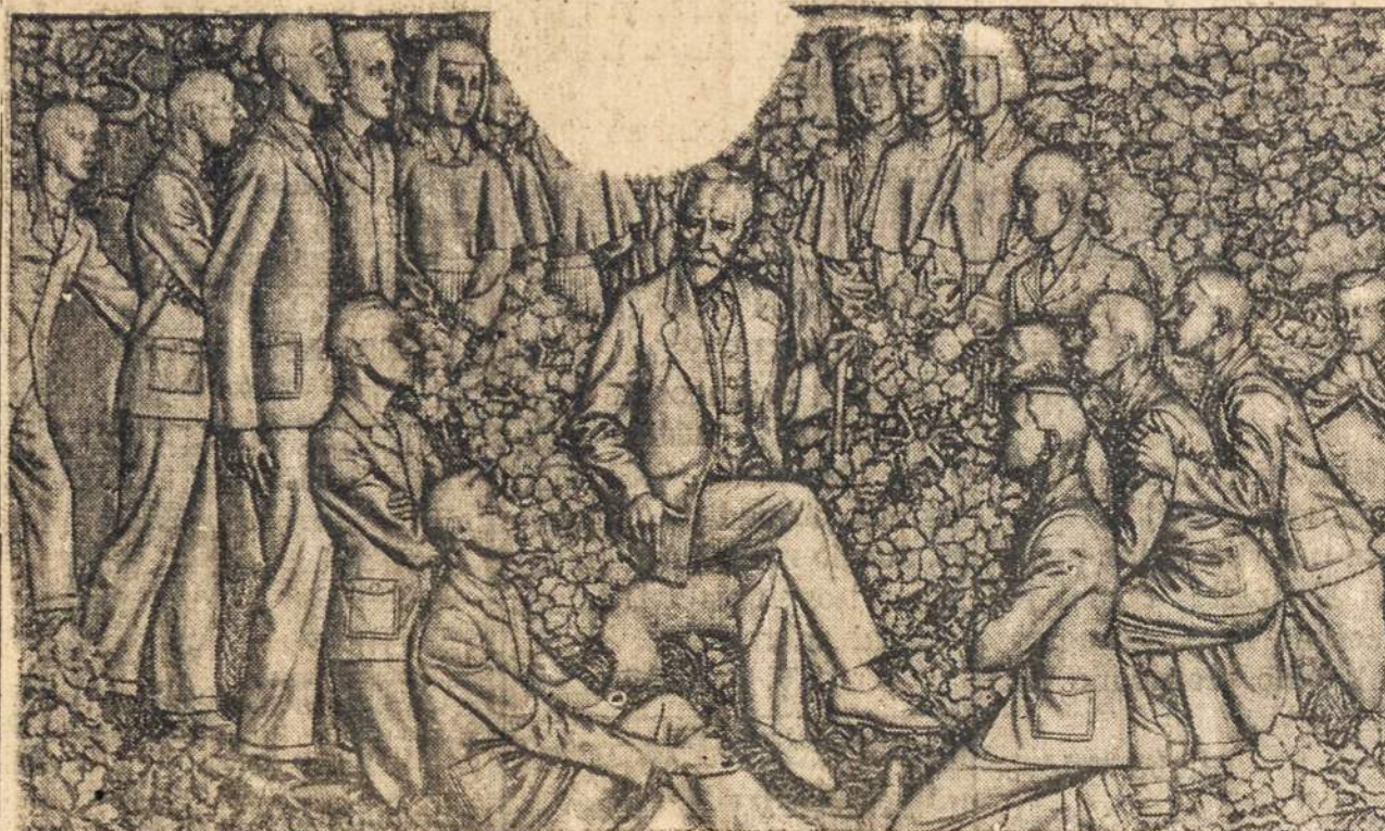
There are a few mural sculptures which adorn the walls of the recently completed Emergès gymnasium (high school) in Lithuania.