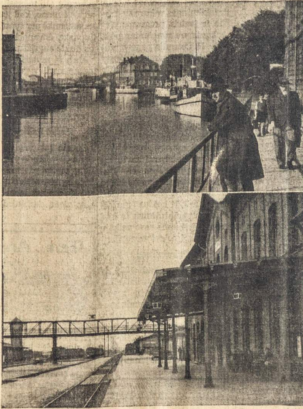
Here are two scenes from the city of Klaipėda (Memel) which has recently figured so prominently in the news. Above is the river Akmenės as it flows through the city, and below is the Klaipėda railway depot.

Jimmy: "It's invisible to the naked eye."