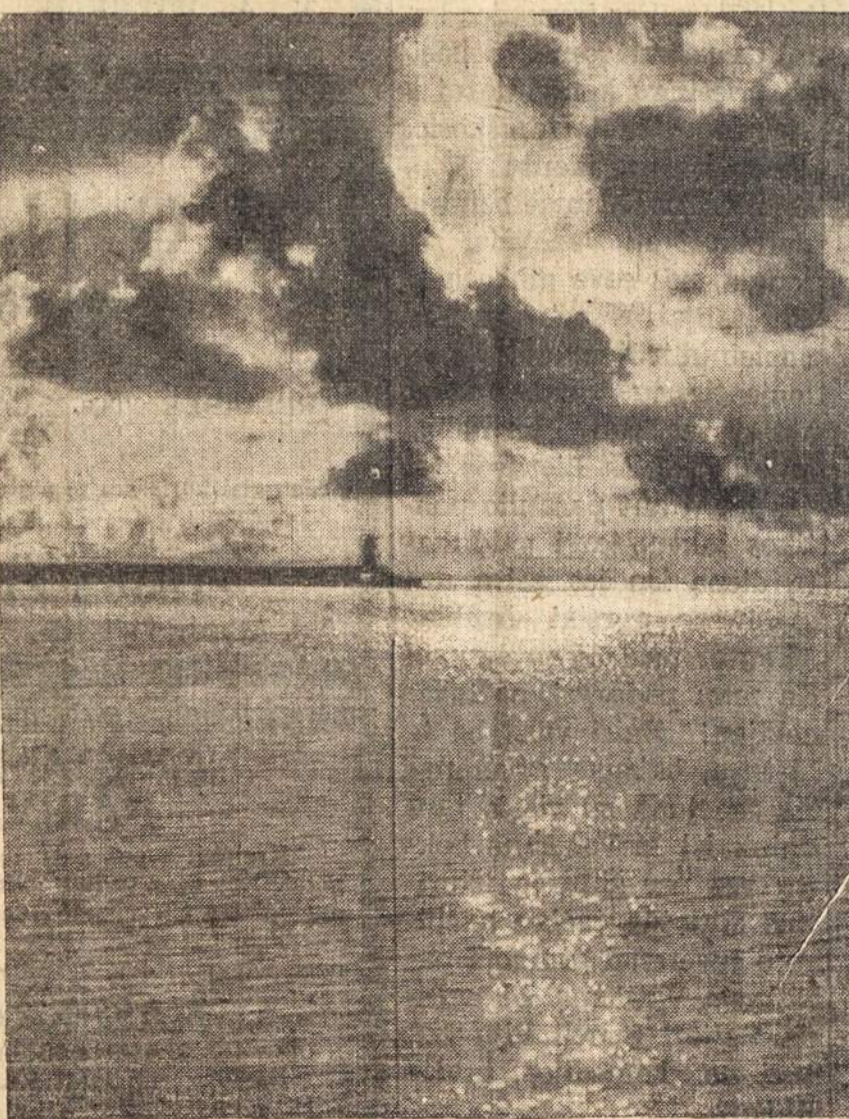
Ten kur Baltijos jura, skalauja Lietuvos krantus