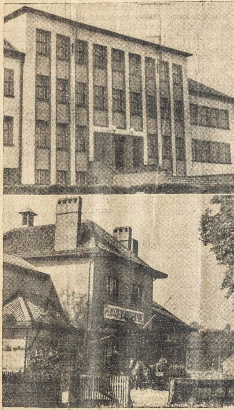
Viršuje, Klaipėdos Pedagoginio Instituto naujai pastatyta pradžios mokykla. Apačioje, Kintų pieninė, kur yra perdirbamas vietos ūkininkų pienas.