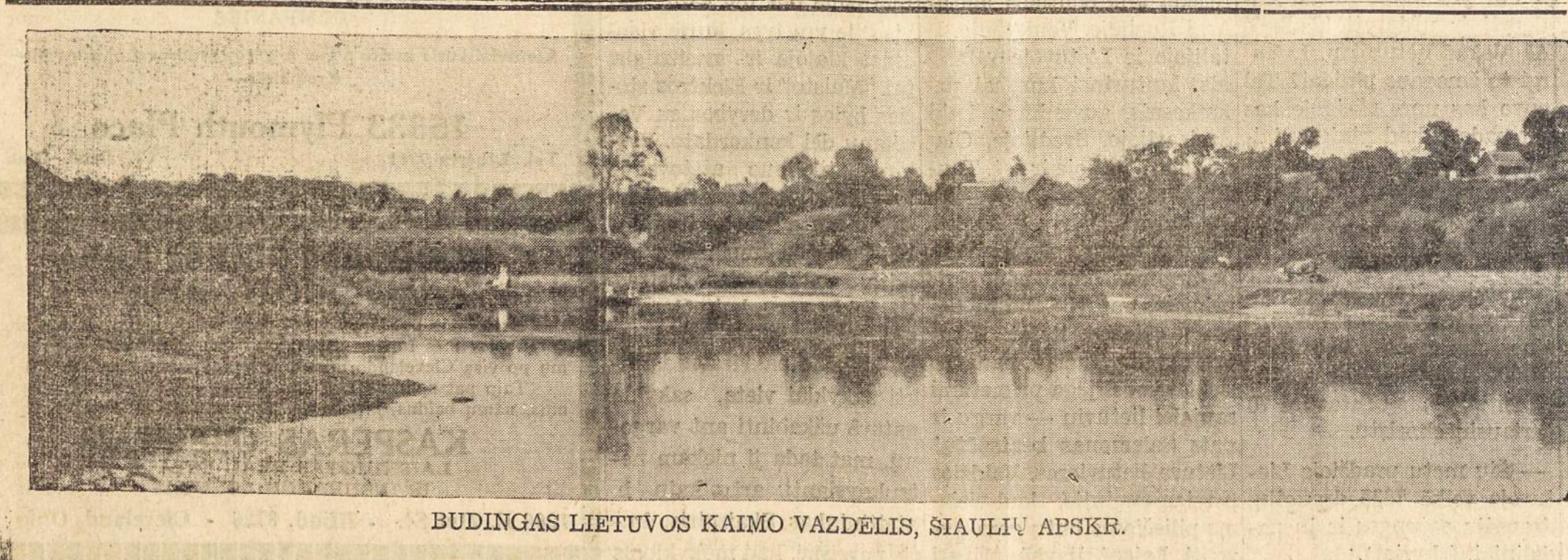
BUDINGAS LIETUVOS KAIMO VAZDELIS, ŠIAULIŲ APSKR.