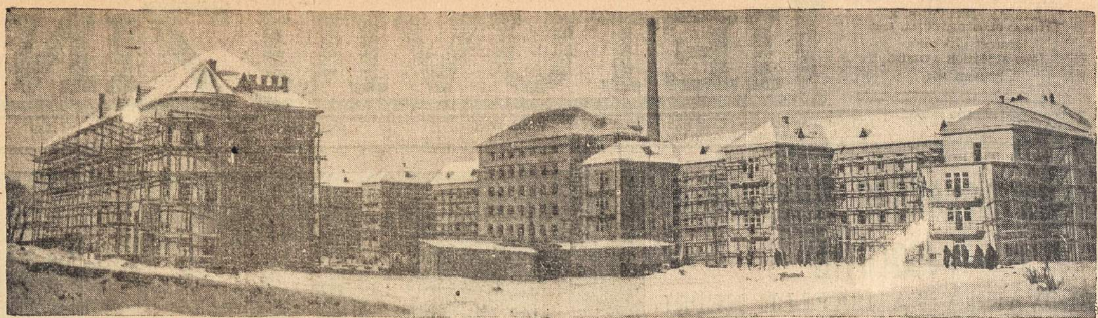
Vytauto Didžiojo Universiteto statomos didžiulės Klinikos Kaune.

Taip, broliai lieuviai, ar jau nelaiikas mums save ir savuosius daugiau gerbti? Nestatykime savęs kitų tautų juoku. Jei mes mylime savo tautą, pradėkime rodyti tą meilę nou vieno asmens o nuo jo priešime prie visos tautos. Tat, mūsų obalsis, svetimųjų tarpe, turėtų veikliai būti, "SAVAS PAS SAVA" "kits už kitą ir visi už vieną." Taip, sekime gerus kad ir žydų pavyzdžius. Išmokime iš kitų.