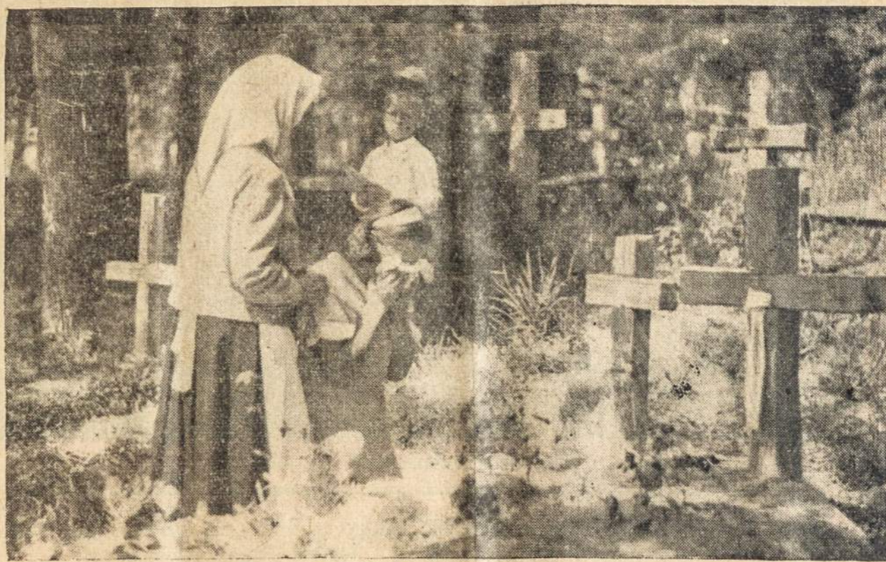
KAPINĖS VILNIJOJE. Jauna našlaitėlė, tetulės globojama, rokuoja savo vargus ant motutės kapo.

KAUNAS, (Elta) — Kompozitorius Stasys Šimkus visam vasaros sezonui apsigyveno Palangoje, kur rašo lietuvišką operą. Šiomet Palangoje žada atvykti vasaroti eilė žymesnių svečių iš Lenkijos, jų tarpe Varšuvos burmistras Staržinskis, Lenkijos pasiuntinys Kaune nariai ir nemaža lenkų politikų