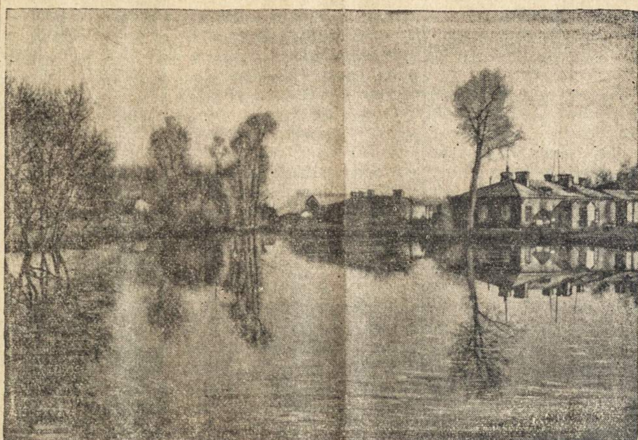
Rytmečio atspindžiai Lietuvos kariuomenės vasaros kareivinių rajone

"Ass. Press" žiniomis, kad Liepos Ketvirtąją minint tik 2 asmenys žuvo nuo priemoninių ugnių visose J. A. Valstybėse. Bet kitų nelaimių yra daug. Per tris dienas, susijusias su Liepos Ketvirtąją, automobilių nelaimėse žuvo 248 ir apie 145 asmenys prigėrė ežeruose ir upėse. Miestuose nelaimės sumažėjo, nes daugumas gyventojų buvo išvykę į p. ovinciją.