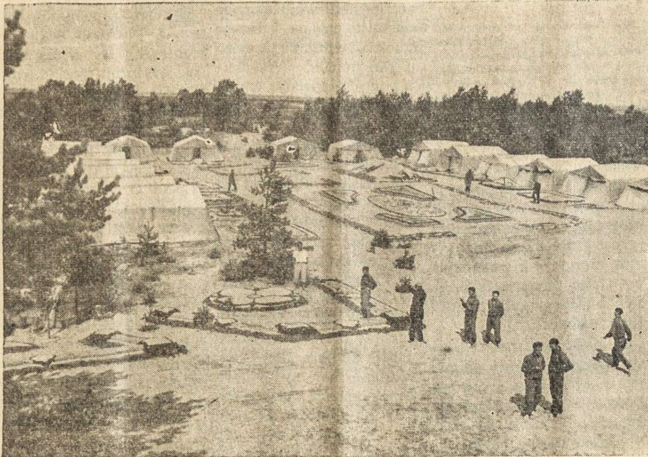
Šitaip stovyklauja Lietuvos mokytojai atostogų metu

ALTUS. — Neseniai muziejus persikėlė į naujas patalpas ir naujai sutvarkytas, tačiau lankytojų atsilanko nelabai daug, nes nežino kur yra naujosios patalpos.