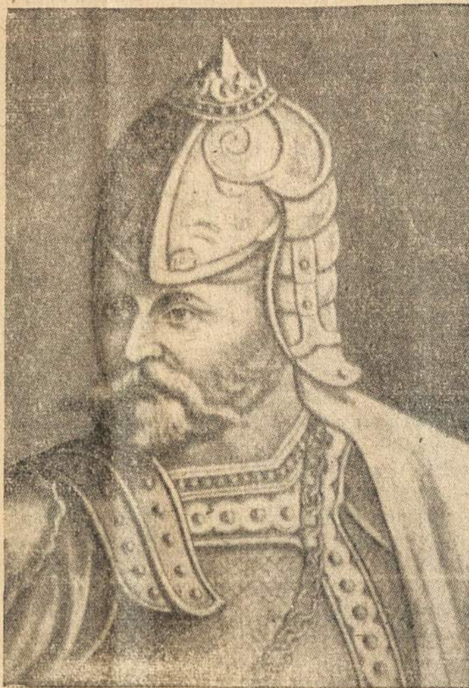
Didysis Lietuvos Kunigaikštis Gediminas, kris 1315 metais užėmęs Lietuvos valdovo sostą, gražiose Neries ir Vilnelės tarpkalnėse įkūręs Vilnių ir iš Trakų perkėlęs Lietuvos sostinę. Ilgai buvęs svetimųjų pavergtas Vilnius vėl atgautas ir spalio 28 d. į jį įėjo Lietuvos Kariuomenė.

KAUNAS (E) — Klaipėdo- je Lietuvai numatytoji lais- voji uosto zona, kuri yra pas- kirta prie muitinės, jau ap- tvirta ir baigiama sutvarkyti taip, kaip nmatyta susi- starime tarp Lietuvos ir Vo- kietijos. Klaipėdoj teigiama, kad laivų zona bus per- duota Lietuvai spalio 15 d.