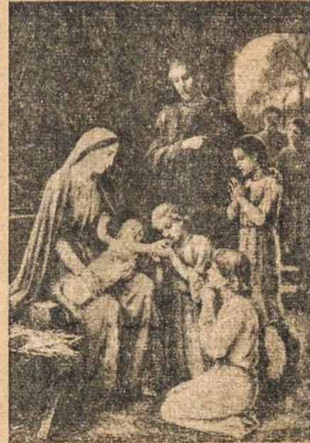
SVEIKI SULAUKĖ SVENTŲ KALEDŲ

I VILNIU KELIAMA V. D. UNIVERSITETO DALIS I Vilnių keliami Teisių Humanitarinių Mokslių Teologijos - Filosofijos fakultetai.