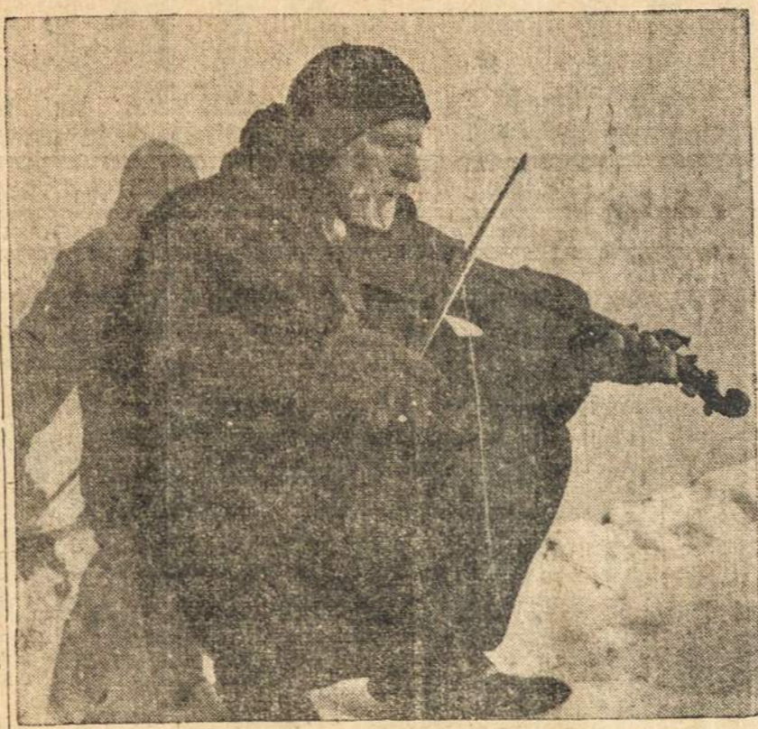
Vilniaus vaizdai: Smuikininkas prie Vytauto Didžiojo Katedros.

—Prekybos derybos Berlyne eina sklandžiai. Gerai vystosi prekyba su Sovietais. Žibalo ir gazolino Lietuvoje turima pakankamai.