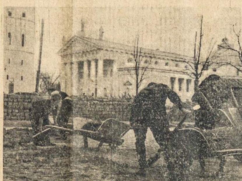
Tvarkoma Katedros aikštė Vilniuje