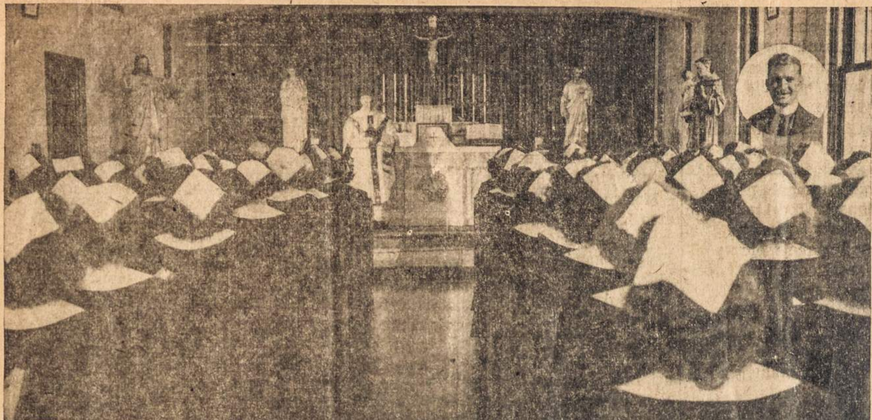
Šv. Pranciškaus Seserų Akademijos Kcplyčia Pittsburgh, Pa.