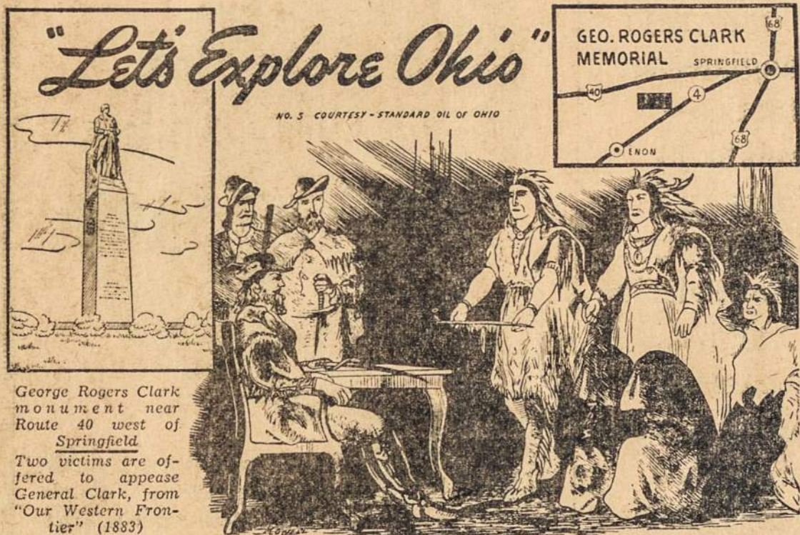
George Rogers Clark monument near Route 40 west of Springfield. Two victims are offered to appease General Clark, from "Our Western Frontier" (1883)