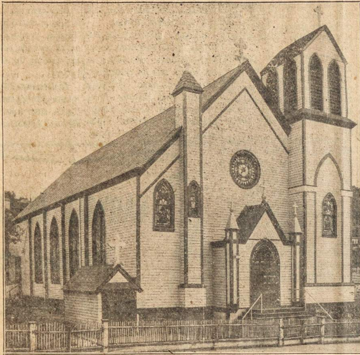
Šv. Vincento parapijos bažnyčia, Pittsburg, Pa.