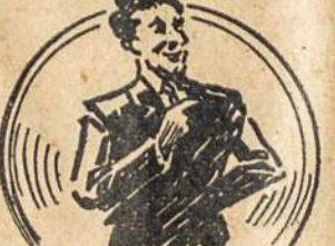
PASSED STATE BAR EXAMINATION IN 1920 WITH SECOND HIGHEST HONORS IN CLASS OF 160 APPLICANTS