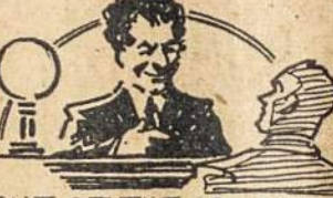
ONE OF THE ABLEST JUDGES OF THE MUNICIPAL AND COMMON PLEAS COURT