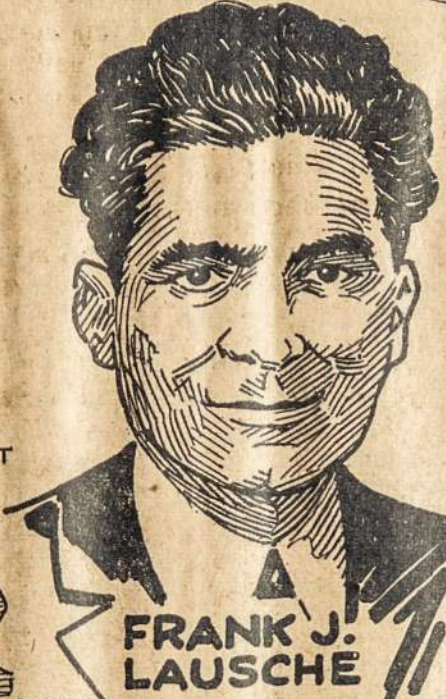
FRANK J. LAUSCHE OUR NEXT MAYOR!