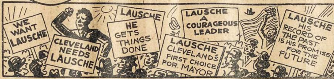
1935 - 1937 - 1939 - LAUSCHE BOOMS FOR MAYOR WERE LAUNCHED - 1941 - ACCEPTED THE CHALLENGE AND LED IN THE PRIMARY ELECTION BY OVER 21000 VOTES OVER NEAREST RIVAL

Gražu yra ir pagerėjimai dažniau suruosti tokių vakarų.