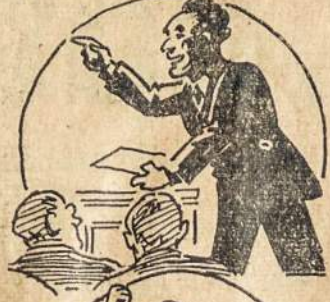
IN 1940 WAGED SUCCESSFUL WAR ON RACKETEERING

BECAME ONE OF THE BEST TRIAL LAWYERS IN CLEVELAND