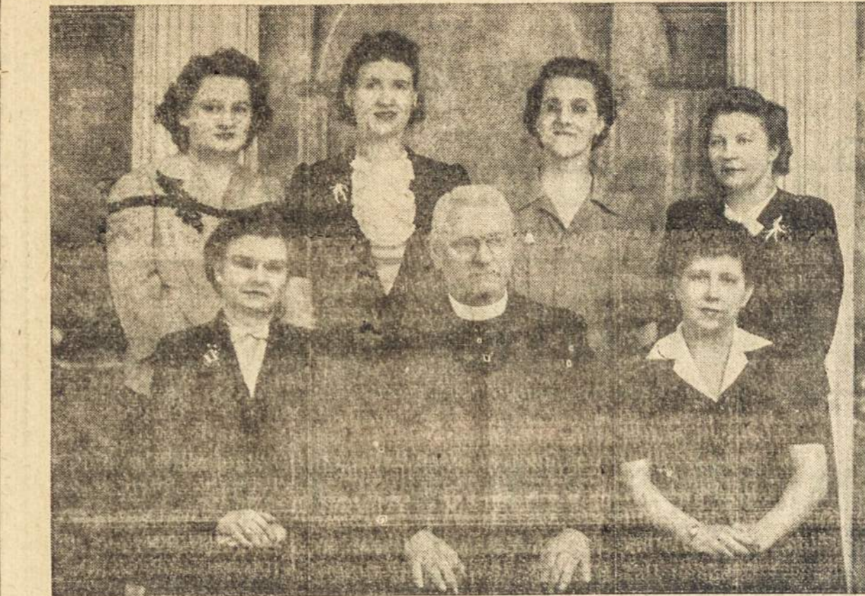
SV. KAZIMIERO AUKŠTESNĖS MOKYKLOS MOTINŲ KLUBAS (S. S.) PITTSBURGH PA.